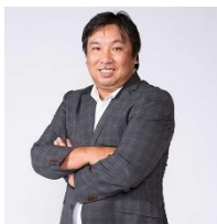
鳴門市移住交流PR大使 元プロ野球選手 里崎 智也